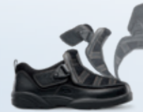
Modell Edward-X: einfacher Einstieg dank weiter Klettverschluss-Öffnung